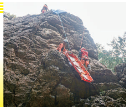
▲山岳救助隊 活動写真

いざという時に、役に立つのが「登山届け」です。消防・警察の山岳救助隊は、提出された登山届けの情報をもとに、捜索活動を行います。登山届けは、登山口に設置してあるポストや、埼玉県警察のホームページからも提出できます。また、家族や身近な人に渡しておくだけでも大きな情報源となり早期救出につながります。