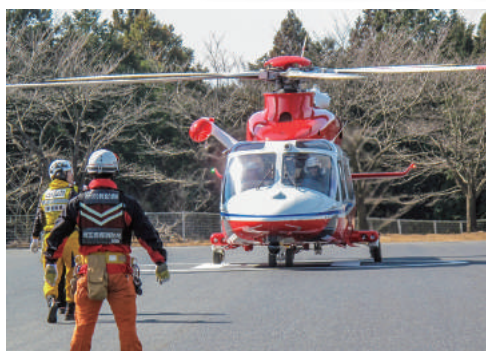
◀防災航空隊 活動写真

平成29年3月28日に埼玉県防災航空隊の緊急運航業務に関する条例の一部が改正され、平成30年1月1日から埼玉県内の一部の山岳地域において、埼玉県防災航空隊の緊急運航により救助を受けた方は手数料を納付していただくことになりました。