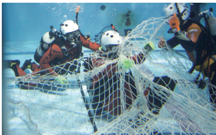
▲水難救助隊 活動写真