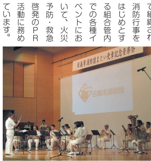
本年7月には、日高市消防団まとい受章記念音楽祭に出演しました。