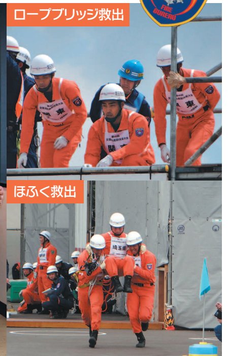
▲左：大会入賞者、指導者及び幹部職員／右：大会の様子