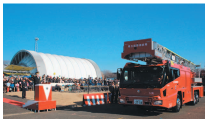
迫力ある車両分列行進の様子