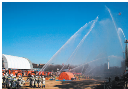
消防隊及び所沢市消防団による一斉放水の様子

実施日時 平成30年1月7日(日) 10時00分～12時00分(雨天中止) 実施内容 式典・徒列分列行進・救助基本訓練・車両分列行進・和太鼓演奏・はしご乗り演技・消防活動訓練・消防団一斉放水訓練 消防車両、住宅用火災警報器等の展示を行います。