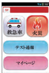
スマートフォンの画面

音声による119番通報が困難な方々が、携帯電話やスマートフォンを使って簡単に119番通報できる(web119)や(FAX119)の登録を受け付けています。