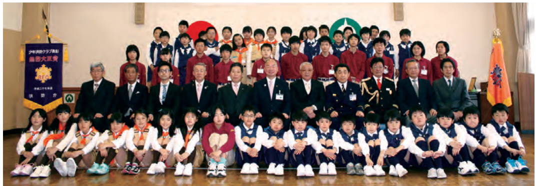
上段：平成27年度入間消防署更新車両 下段：入間市消防少年団が総務大臣賞を受賞