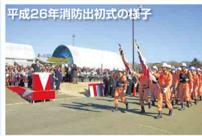
平成26年消防出初式の様子