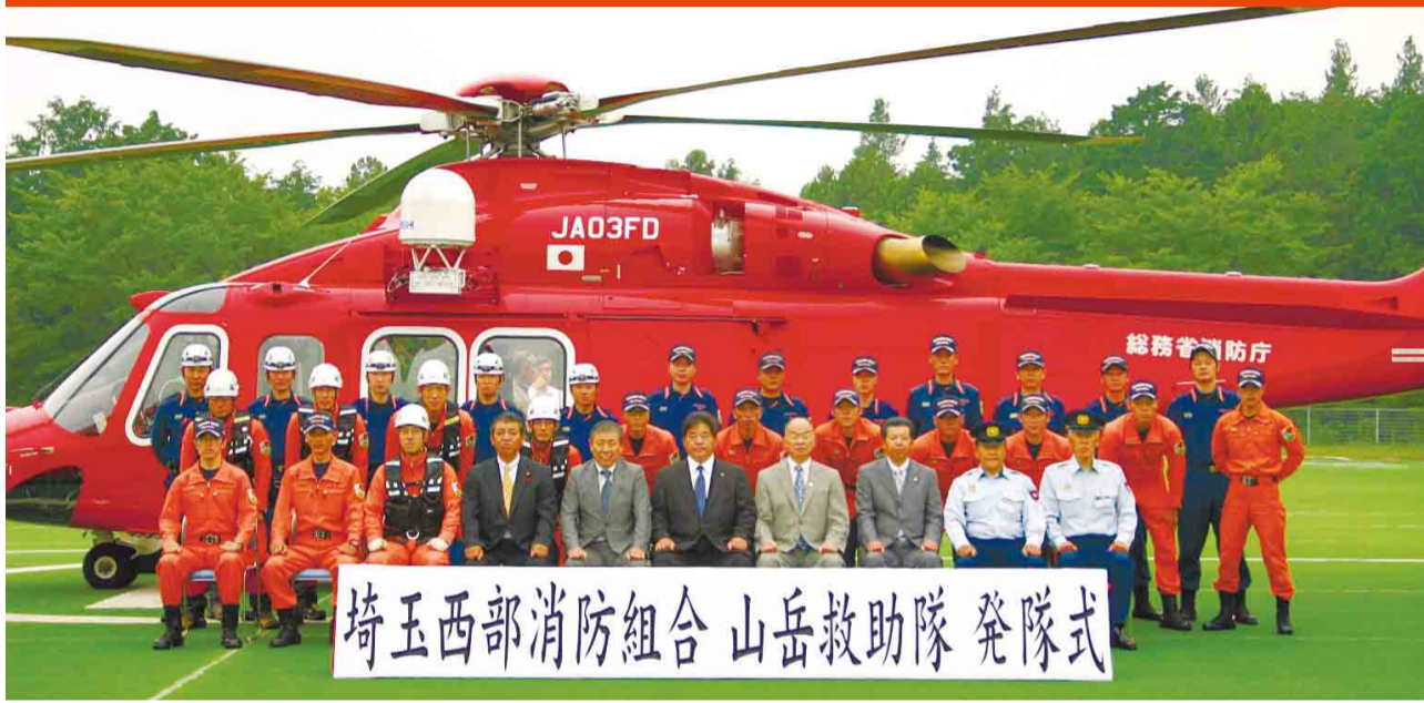
埼玉西部消防組合 山岳救助隊 発隊式