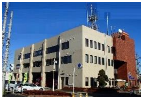
埼玉西部消防局 所沢中央消防署