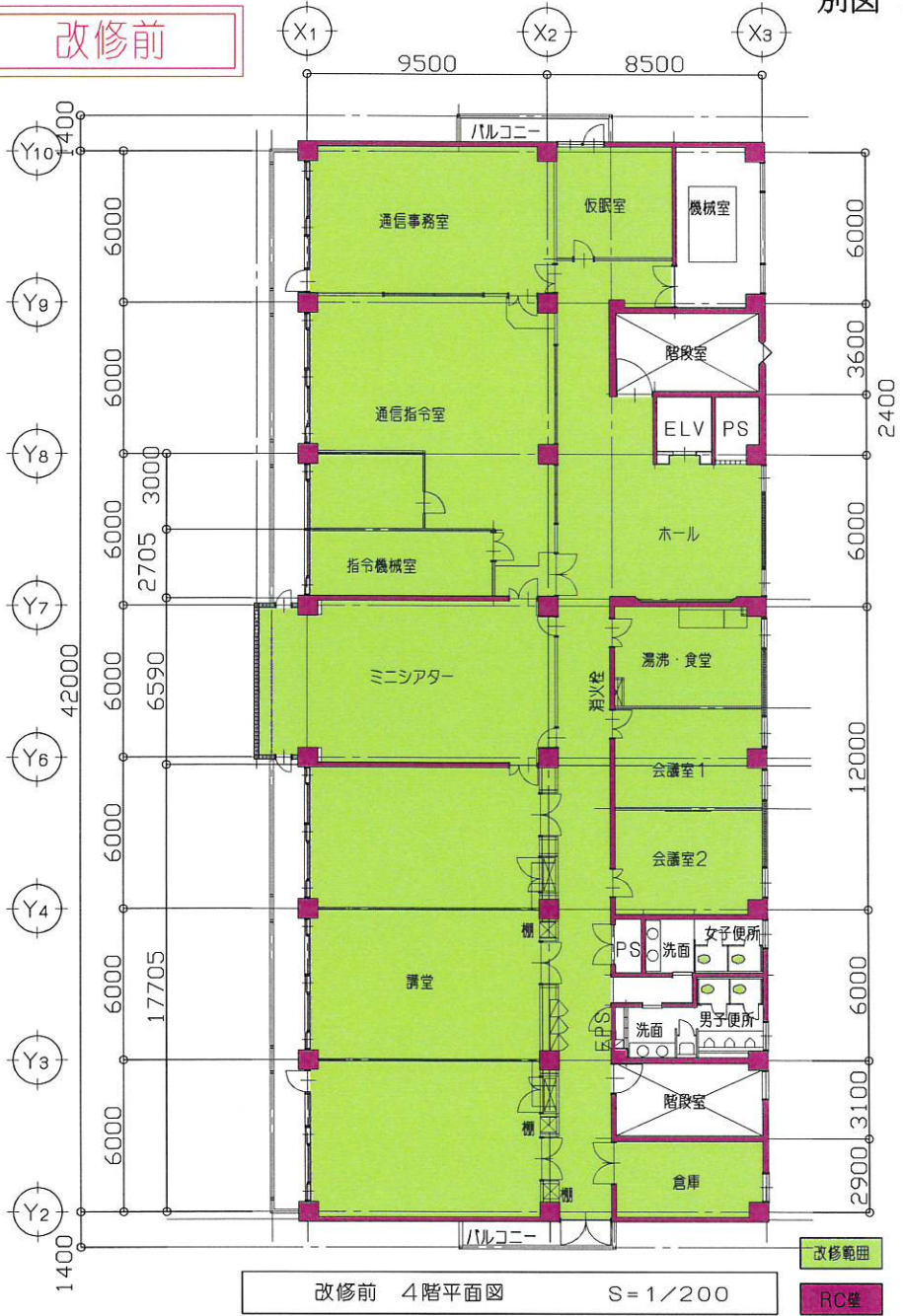
改修前 4階平面図 S=1/200 RC造