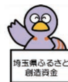
埼玉県のマスコット「コバン」