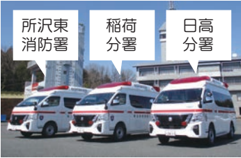
高規格救急自動車購入(3台) 9,510万9千円