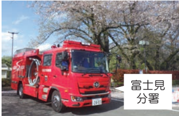
化学消防ポンプ自動車購入(1台) 8,305万円