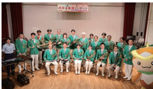
埼玉西部消防組合 消防音楽隊の音色が 出初式を盛り上げます!