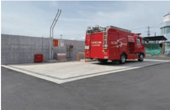
三ヶ島分署自家給油施設周辺 舗装整備工事 2,482万7千円

「埼玉西部消防組合人事行政の運営等の公表に基づく条例」に基づき、組合職員の給与などの状況を公表します。なお、詳細は公式ホームページでご覧になれます。