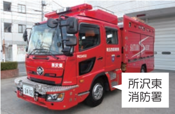
救助工作車購入(1台) 1億1,407万円