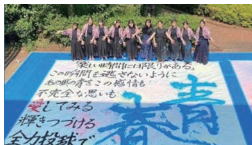
初出演! 県立所沢中央高校書道部によるパフォーマンスをお楽しみに!